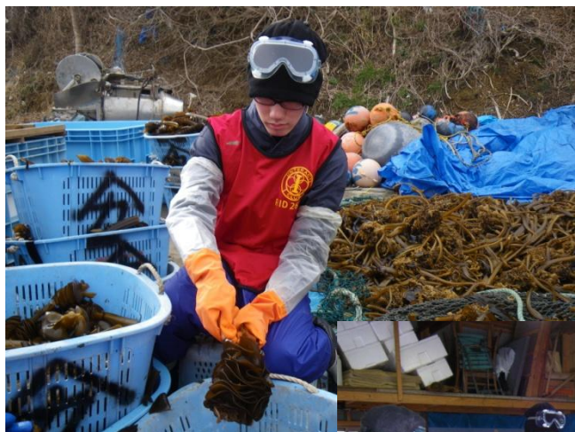
小湊浜でのワカメ漁のお手伝い