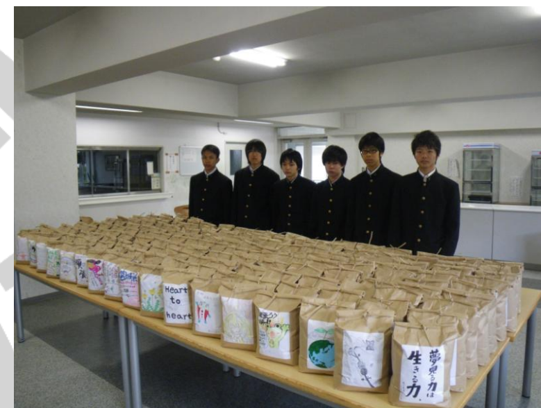
160世帯分(800kg)のお米を用意

東日本大震災発生から1年がたち、現地のニーズも生活再建へシフトしていくなかで、中高生がお手伝いできるボランティアとして、漁村でのワカメ漁のお手伝いと、仮設住宅への生活物資の支援のプロジェクトを企画・実施しました。現地での活動に先立ち百合学院高校・仙台育英学園高校 IAC、神戸女子大学・神戸 RAC、(株)神明(神戸 RC)と連携し「お米のひと握り運動」を実施。仮設住宅へお渡しするお米のご寄付を募りました。また、米袋には思いを込めたメッセージカードを作成し添付しました。参加校：明石西高校 IAC・滝川高校 IAC・滝川第2高校 IAC アクター・顧問計31名